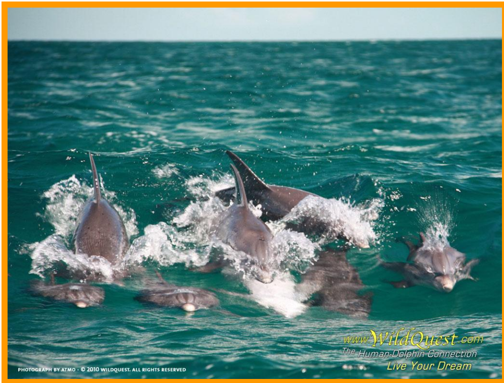
Il posto fantastico nell' USA dove siamo stati in gravidanza: www.wildquest.com