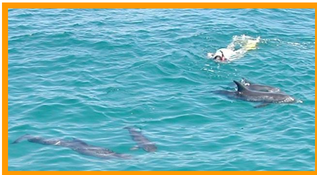
Io da sola nell'Oceano atlantico con i delfini