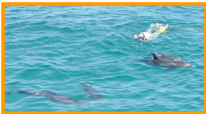
Ik alleen met de dolfijnen...

Uiteindelijk, diezelfde ochtend nog, kwamen de eerste dolfijnen rondom de boot gezwommen...ongelooflijk wat een emotie bij iedereen en wat mooi!