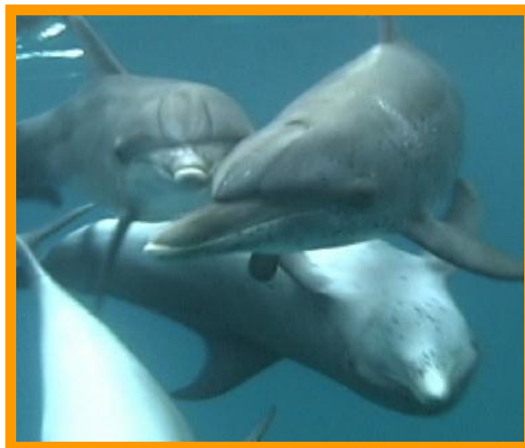
Boven en onder mij...overal dolfijnen!

Kort daarop lieten ze er nog een persoon in en de dolfijnen verdwenen op slag...het was voorbij en ik wist meteen: dit kwam nooit meer terug!