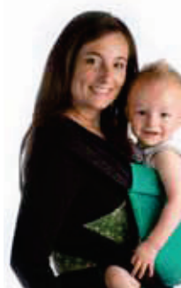
BDDTAI.983 verde & nero