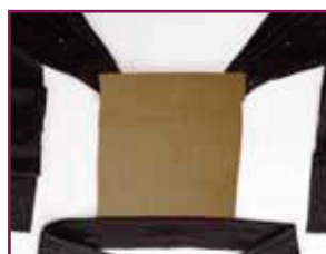
BDDTAI 985 Stone fruit – sabbia-bretelle nere