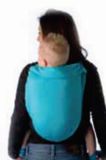
BDDTAI.984 blu & nero