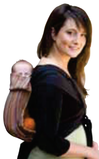
BDDTAI.981 Rigato ananas & nero