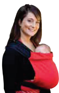
BDDTAI.980 rosso & nero